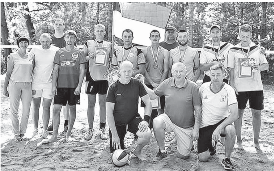
Переможці турніру з пляжного волейболу серед чоловіків — збірна команда Лугин.