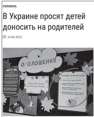
Ілюстрація № 1

Під час інформаційної війни Росії проти України мета одна — знищити унікальну згуртованість, яку продемонструвало наше суспільство. А для цього нас слід посварити, тобто розділити. Згадайте, які «хвилі» обурення однієї частини суспільства іншою ширились останнім часом. Про тих, хто п'є каву в Європі, поки «хлопці б'ються на фронті, а ми потерпаємо в тилу». Про те, що начебто воюють лише представники західних областей України, а «східняки» відсиджуються. Чули таке? І безліч інших висновків, підґрунтям