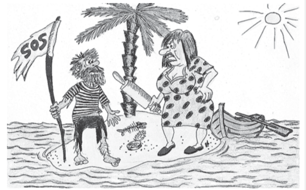
— Ти ба, вдома діти голодні, а він тут собі курорт влаштував!

Сільська дискотека. Хлопець підходить до дівчини: — Танцюєш? — Ні! — Чудово, пішли — трактор допоможеш попхати.