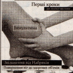
Перші кроки до полегшення

Як врятувати ноги від набряків за тиждень та зробити пересування більш комфортним?