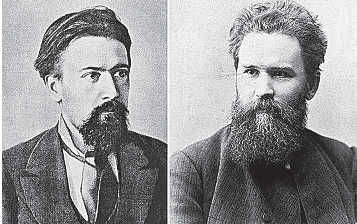
Микола Кибальчич та Володимир Короленко.

ПОМІЖ багатьох вулиць Житомира, які названі на честь визначних людей, є й такі дві: Короленка і Кибальчича. Перша з них розпочинається у центрі й тягнеться у західному напрямку, друга — розташована у східній частині міста. Одна названа на честь видатного письменника-уродженця Житомира, інша — в пам'ять про революціонера й винахідника, теоретика міжпланетних польотів.