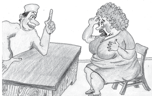
— Як кажуть класики: «Ми є те, що ми їмо». — Лікарю, присягаюся, я ніколи не їла таку стару, товсту і всім незадоволену жінку.