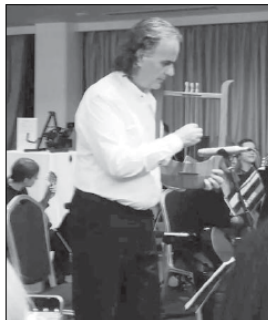
Засновник та головний виконавчий директор WORLD GUITAR DAY Yorgos Foudoulis

Святкування «Всесвітнього дня гітари 2022» реалізовано під егідою ЮНЕСКО та за підтримки десятків регіональних та міжнародних агентств.