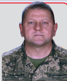
Валерій ЗАЛУЖНИЙ, Головнокомандувач Збройних сил України

«Ми ведемо війну проти країни, розмір якої у 28 разів більший за розмір нашої держави, населення якої чисельніше за наше у 4 рази, військовий потенціал якої кратно перевищує наші можливості. Ми ведемо війну на суходолі, у повітрі, на морі, в кіберпросторі тощо. Ми ведемо війну не 8 місяців, а 8 років і 8 місяців. Усе це свідчить про нашу стійкість, мужність захищати своє і жагу перемогти.»