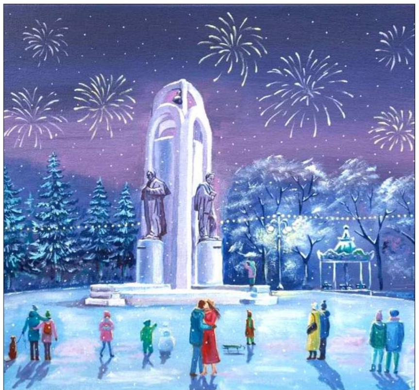
Картина Тараса Сорочака.