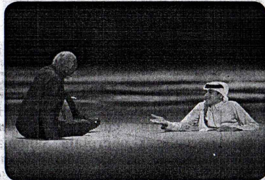
СТОР. 4 ЯК СТАРТУВАВ ЧС З ФУТБОЛУ СТОР. 5

Йди в ногу з часом читай нас в електронному форматі. Більше інформації про життя міста, ближнього та далекого зарубіжжя можна знайти на нашому сайті: https://gorozhanin.info МИ ПРАЦЮЄМО ДЛЯ ВАС!