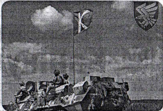
ВІТАЄМО ДЕСАНТНИКІВ УКРАЇНИ