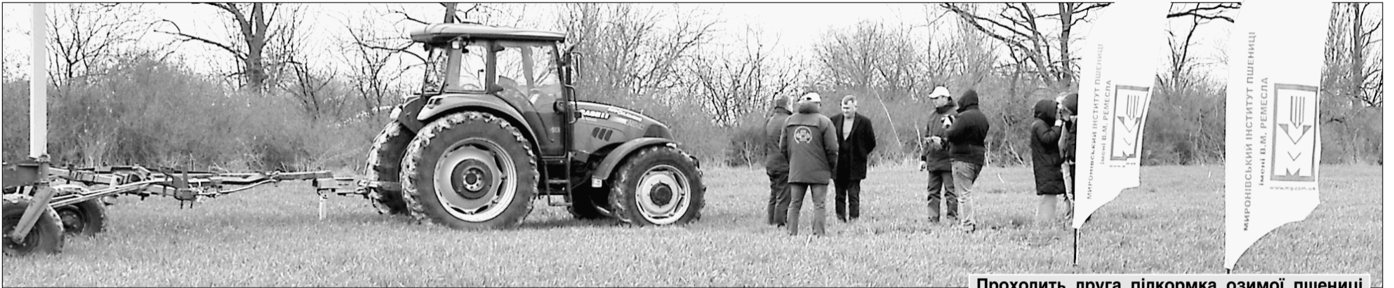
Проходить друга підкормка озимої пшениці

Зі нового року ми поновили публікацію тижневої ТВ-програми