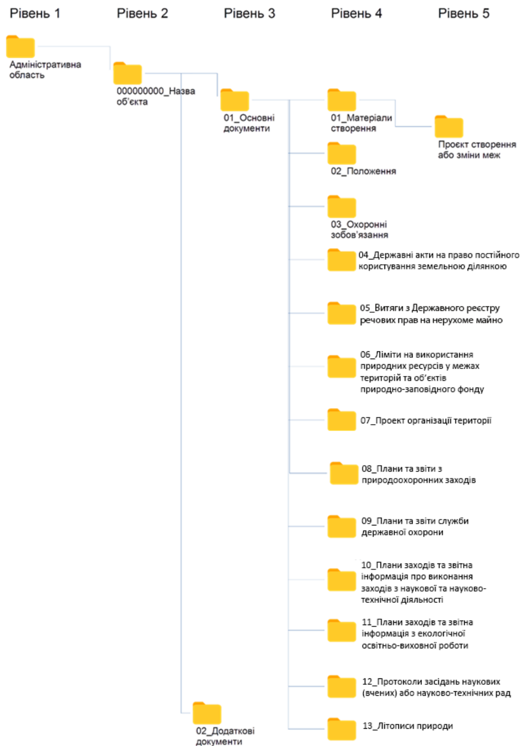
Рисунок 2.7 Структура архіву (до підпункту 3 пункту 7 розділу II цієї Інструкції)