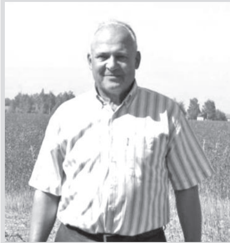
Із пов гою колектив обл сної г зети «Село полт вське».

Божого бл гословення В м н мног я і бл г яліт!