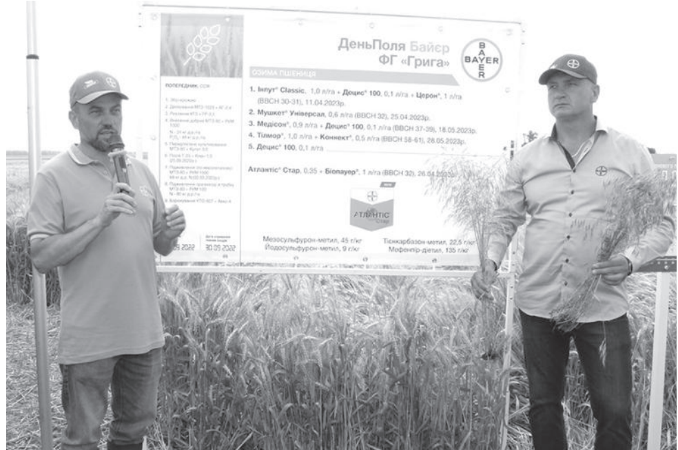
Із системою захисту пшениць та ячменю присутні ознайомили фахівці компанії БАЙЕР.

товий новий високоврожайний, посухостійкий сорт виробництва «RAGT Semences» – РЖТ Депот, котрий цього року вже доступний в продаж. Додати лише те, що дві роки поспіль на полях ФГ «Григ» РЖТ Депот покзав на вищій результат.