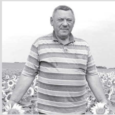
Із пов гою колектив ред кції обл сної г зети «Село полт вське».

Нех й людськ ш н буде подякою В м з плідну пр цю, чуйність, людяність, уміння творити добро, доля й н д лі зб г чує В с мудрістю, енергією т н тхненням!