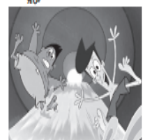
17.30, 22.30 М/с «Деніс і Нешер. Без обмежень» 18.00, 22.00 М/с «Геомікс» 23.00 М/с «Баранчик Шоу» 23.30 М/с «Єдині новини» 0.00 М/с «Місія Блейк» (не фото)