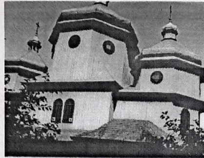
"Дерев'яна церква у с. Потік, пов. Рогатин". Фот. Володимир Гребеняк, 1912 р. (збірка Національного музею у Львові імені Андрея Шептицького)

Найцікавішими стали храми у селах та містечках, створені на основі візантійського стилю. З іменем В. Нагірного пов'язують створення новітньої галицької школи сакрального будівництва.