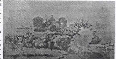
"Церква у с. Потік коло Рогатина". Худ. Осип Курилас, 1916 р. (збірка Національного музею у Львові імені Андрея Шептицького)

Однак, найбільше сил В. Нагірний вклав у професійну діяльність як архітектор, створивши проєкти понад 200 церков, більшість із яких були реалізовані.