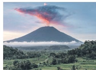
Вулкан Агунг на острові Балі (Індонезія)

Наприклад, сьогодні через людську діяльність – насамперед спалювання газу, нафти та вугілля, до атмосфери потрапляє в десятки разів більше вуглекислого газу, ніж вивергають усі вулкани на планеті.