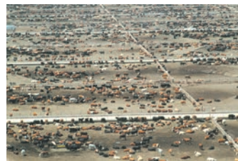
Ферма в Колорадо. З усіх продуктів харчування яловичина має найбільший вуглецевий слід

Автори згаданої статті з "Nature Food" дали свою відповідь, і вона звучить ствердно. Потрібно змінити дієту: зменшити, наскільки це можливо, споживання м'яса й молочних продуктів на користь їжі рослинного походження.