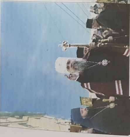
ПРЕДОСТАТЕЛЬ ПЦУ ЕПІФАНІЙ у п'ятницю, 9 лютого, представив у Чернівцях керівника об'єднаної Чернівецько-Буковинської єпархії єпископа ФЕОГНОСТА.

Предстоятель Православної церкви України ЕПІФАНІЙ представив керівника новоствореної єпархії