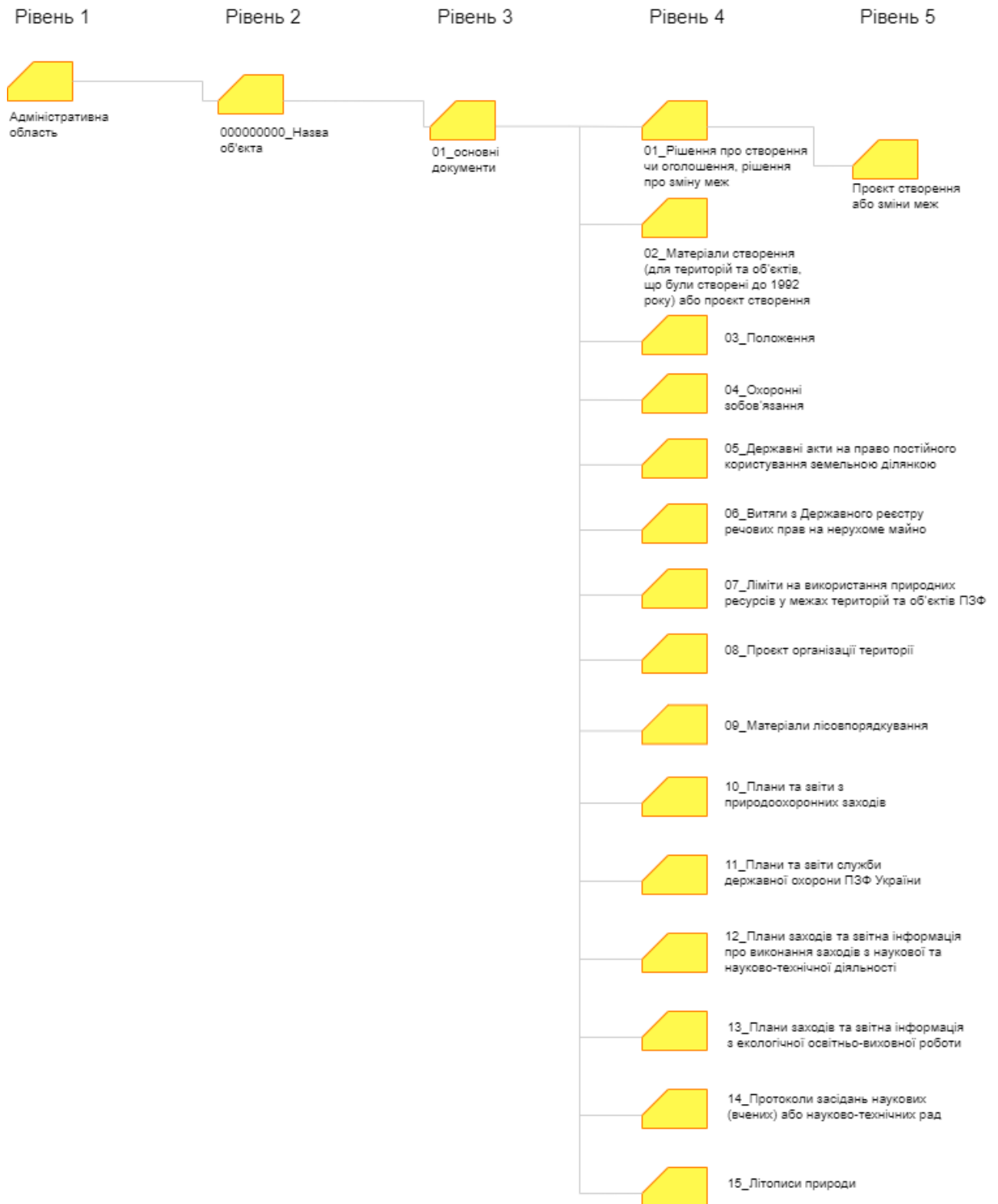
Рисунок 2.4 Структура архіву (до підпункту 3 пункту 6 розділу II цієї Інструкції)