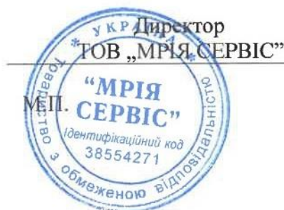
Шитюк К.Ф. (посада, прізвище, ініціали та підпис керівника)