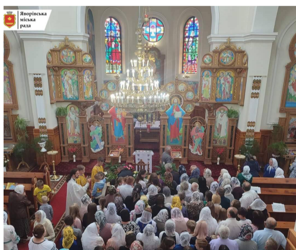
30 ТИСЯЧ ГРИВЕНЬ НА ДРОНИ ВІД ВІЖОМЛЯНСЬКОГО ОКРУГУ

З його слів, також гарний результат показав Віжомлянський округ, жителі якого і моляться за Перемогу, і займаються благодійністю. «Завдяки небайдужим мешканцям Віжомлянського округу зібрано 30 тисяч