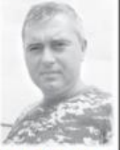
Щиро — журналісти «Черкаського краю»